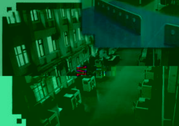
DMG 数控技术 训练场所