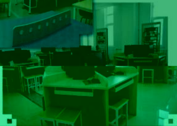
一体化课程教学设计 综合实训室